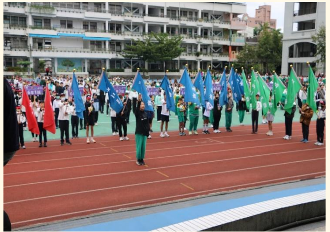
運動會-運動員宣誓